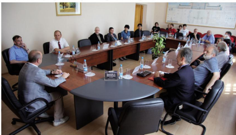
Круглый стол по проблемам ядерной физики

В рамках конференции Джеймс Вэри выступил перед студентами и сотрудниками ТОГУ с популярной лекцией о