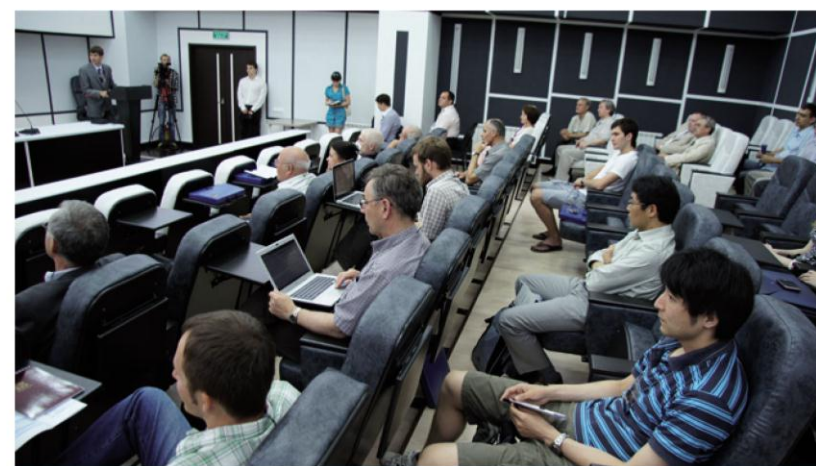
В конференции приняли участие и учёные с мировым именем, и молодые аспиранты

современном состоянии и перспективных направлениях исследований в теоретической ядерной физике. Он раскрыл ребятам понятным языком все стороны сложной науки.