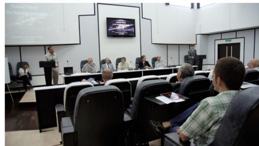
Открытие конференции в Бизнес-инкубаторе ТОГУ